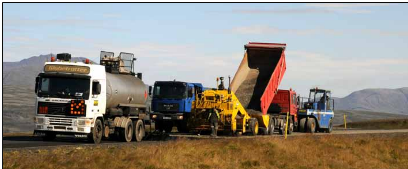
Verktaki leggur klæðingu á Þingvallavegi. Í opnu þessa blaðs er kort sem sýnir bundið slitlag á landinu og nýlagnir 2011.