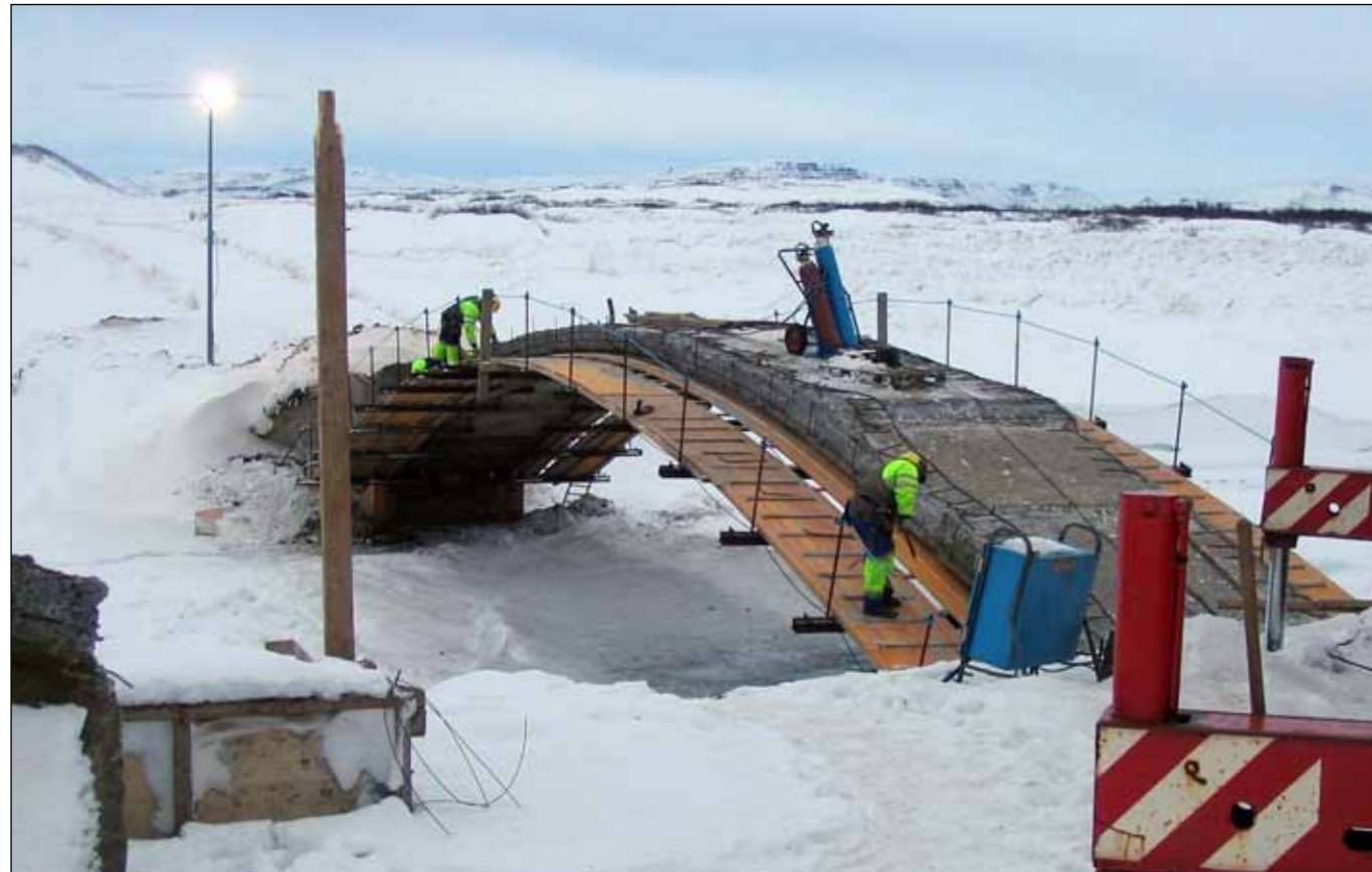
Brúarvinnu menn frá Hvammstanga gera upp gamla brú yfir Haffjarðará á Snæfellsnesi sem notuð verður sem göngubrú. Viðgerðin felst í að steypa ofan á og utan um bogann. Síðan nýir veggir þar á og dekkið endurnýjað. Allar brúkur endurgerðar í upphaflegu formi og nýir endastólpar. Þá kemur alveg nýtt handrið. Einnig verður það framleitt á vegfyllingum við brúarendu á kantbita. Ljósmynd: Guðmundur Ingi Waage. Mynd frá gagnstæðu sjónarhorni hér fyrir neða Þessi brú var í notkun til ársins 1965 þegar vegurinn færðist að núverandi brúarstæði og brú nr. 2 var byggð. Sú brú var rifin sl. ár þegar sú nýjasta tók við. Ljósmynd: Jón J. Víðis 1956.

ýmsar nýjungar eru að ryðja sér til rúms við hönnun og lögn klæðinga sem nauðsynlegt er að fylgjast með og rannsaka. Mikilvægt er að þróa aðferðir við framleiðslu, útlögn og viðhald malarslitlags sem auka gæði þess.